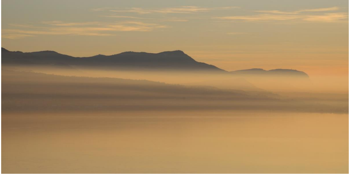
LAKE A PANORAMIC #11 Samedi 3 février 2024, 17h19 Saturday, February 3, 2024, 5:19 pm

J'ai trouvé mon île au trésor. Je l'ai trouvée dans mon monde intérieur, dans mes rencontres, dans mon travail.