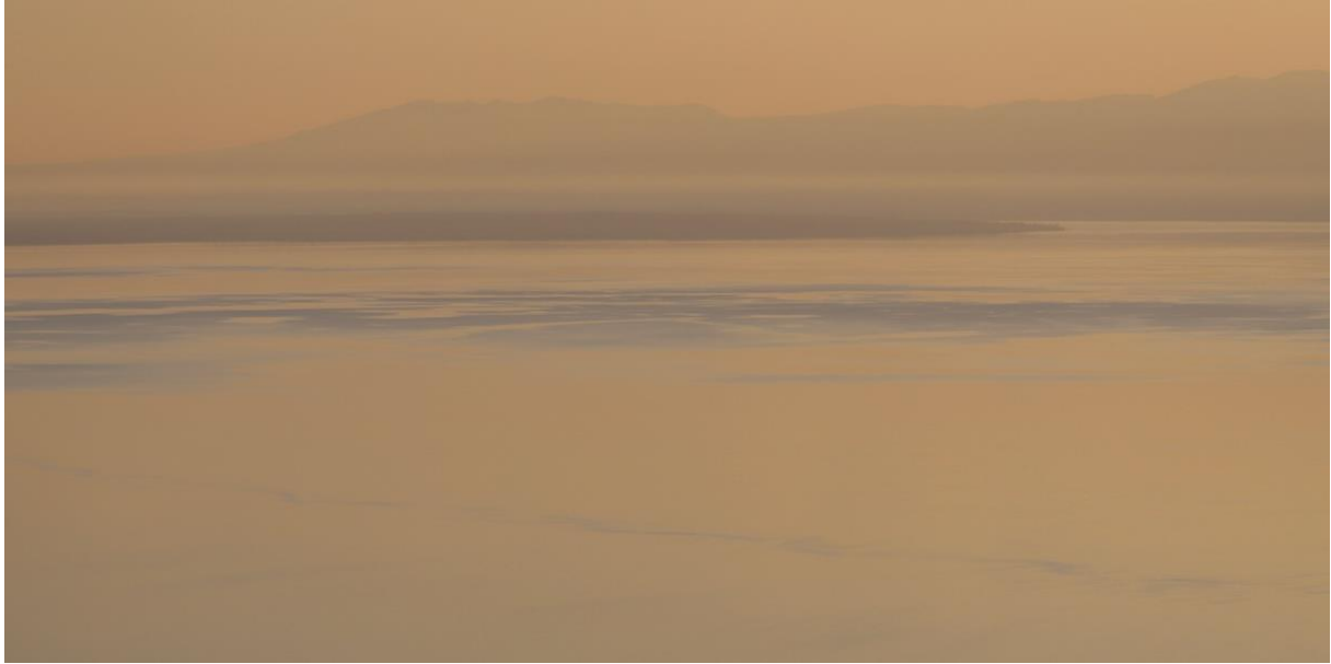
LAKE A PANORAMIC #5 Lundi 29 mars 2021 – 18h57 Monday, March 29, 2021 - 6:57 pm

So quiet and peaceful Tranquil and blissful There's a kind of magic in the air What a truly magnificent view A breathtaking scene With the dreams of the world In the palm of your hand. Freddy Mercury 1946-1991