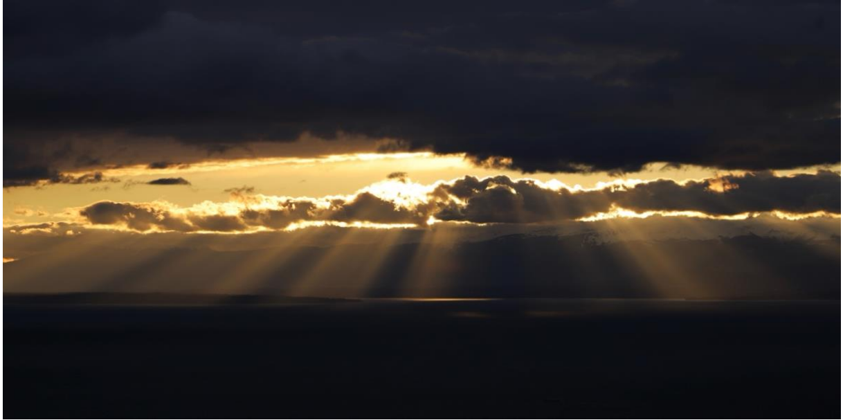
LAKE A PANORAMIC #4 Dimanche 7 février 2021 – 17h43 Sunday, February 7, 2021 - 5:43 pm

Cent jardins sont au-dessous de mon jardin. Le grand miroir du lac les baigne. Je vois toute la Savoie, les Alpes qui s'élèvent en amphithéâtre, et sur lesquels les rayons du soleil forment mille accidents de lumière.