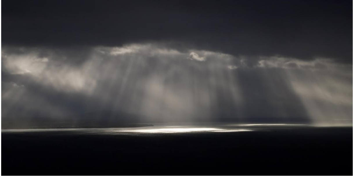
LAKE A PANORAMIC #9 Mardi 31 octobre 2023, 16h37 Tuesday, October 31, 2023, 4:37 pm

Tout est trop grand, décors et eau. Oskar Kokoschka 1886-1980