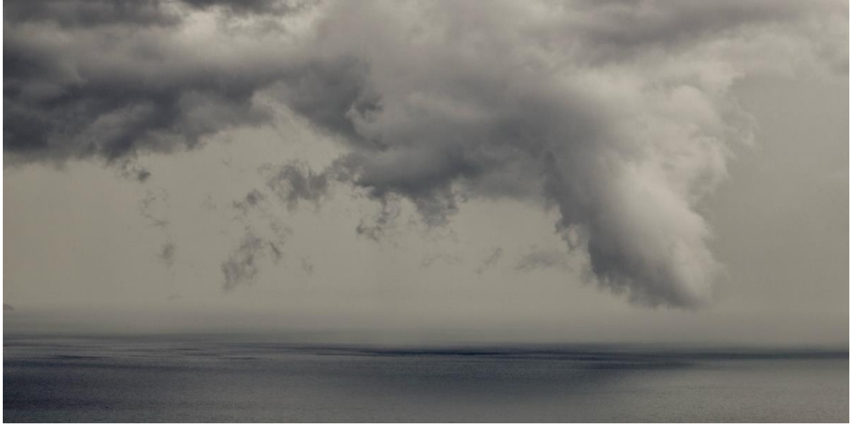
LAKE A PANORAMIC #6 Mardi 11 mai 2021 – 17h58 Tuesday, Mai 11, 2021 - 5:58 pm

Celui qui n'a jamais contemplé le Léman dans la furie ne pourrait concevoir la possibilité du danger dans la nappe d'eau tranquille qui s'étend, pendant l'espace de plusieurs lieues, comme un miroir liquide.