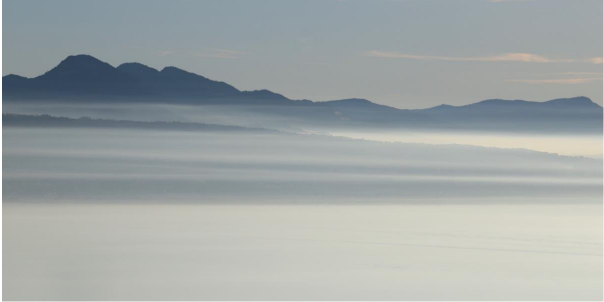
LAKE A PANORAMIC #10 Samedi 3 février 2024, 16h43 Saturday, February 3, 2024, 4:43 pm

Ayant peint les Océans, L'Himalaya, l'Amazone, Fatigué d'avoir vu grand, Dieu créa le bleu Léman. Jean Villard dit Gilles 1895-1982